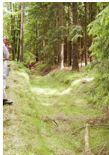
Auch Hohlwege oder Streuobstwiesen gehören zu den vielfältigen Kulturlandschaftselementen.

Die Erfassung selbst geschieht durch das Ausfüllen eines Fragebogens, hauptsächlich durch Ehrenamtliche. Diese werden dazu informiert und geschult werden. Die wissenschaftliche Aufbereitung übernimmt ein Projektmanager. Die Datenbank ist für alle frei zugänglich, so dass sich jeder Bürger Informationen über die Inhalte abholen kann. Erfasst werden sollen Elemente, die noch nicht in Denkmallisten bzw. Listen für Klein- und Flurdenkmäler aufgeführt sind.