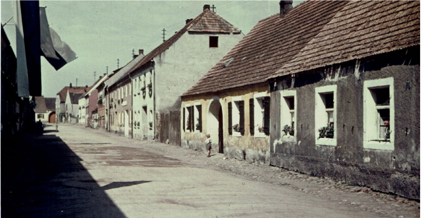
Beil. Bild zeigt die Blumenstraße, im fünften Haus auf der rechten Seite brach 1817 das Großfeuer aus.

Schnaittenbach durchlebte in der Vergangenheit schwere Schicksalsschläge und fürchterliche Katastrophen, wie z.B. beim 30jährigen Krieg 1618 - 1648, der auch in Schnaittenbach durch Plünderungen, Brandschatzung (der halbe Markt war abgebrannt) und andere Plagen großes Unheil anrichtete, beim spanisch-österreichischen Erbfolgekrieg 1741 - 1745, der den Bewohnern ungeheure Lasten auferlegte, beim 7jährigen Krieg (1756 - 1763), bei dem durch dauernde Durchzüge und Abgaben an die Kriegsarmeen die Bürger total verarmten und 1796, als französische Truppen bis zu uns vordrangen, plünderten und brandschatzten, so dass die Schnaittenbacher vor Schrecken in die Wälder flüchten mussten. Auch von verschiedenen Seuchen und Pest wurde man nicht verschont. Mit einer der schwersten Katastrophen war die große Feuerbrunst im Jahre 1817, die etwa 3/4 des Hausbestands von Schnaittenbach und einen Teil der damals selbstständigen Gemeinde Forst in Schutt und Asche legte. Von 96 Häusern in Schnaittenbach wurden 79 Gebäude und 49 Scheunen ein Raub der Flammen.