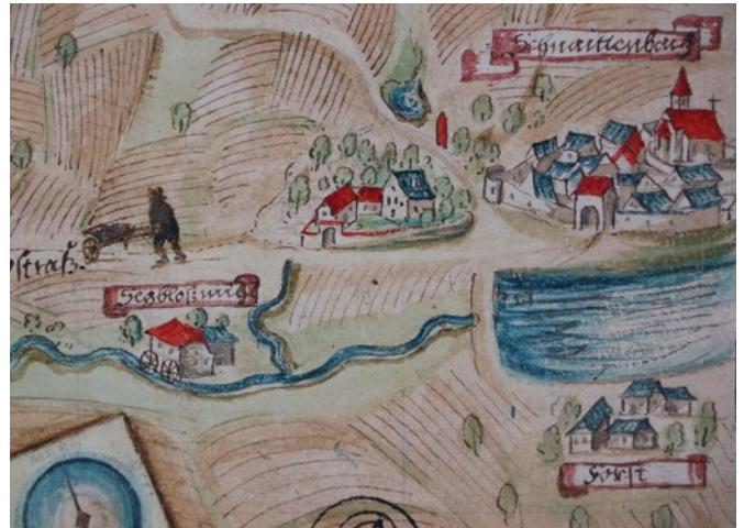
Bild aus dem Staatsarchiv Amberg, so etwa soll Schnaittenbach, der große Weiher und die Gemeinde Forst etliche Zeit vor der Feuersbrunst 1817 ausgesehen haben.